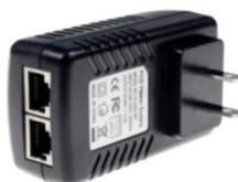
PoEインジェクタ CPI-4805 (オプション)