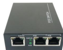
超小型PoEスイッチ CPS-0302-100 (オプション)